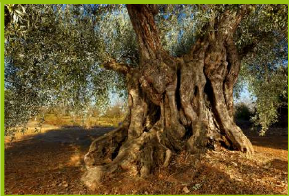
10 Àrea de Càlig G 40.465209 0.347894