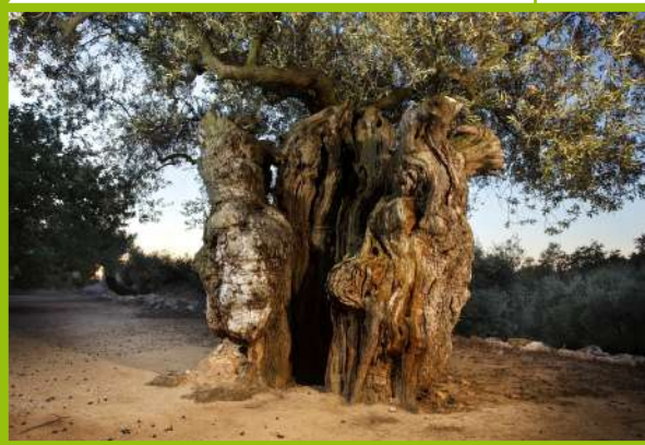
12 Àrea de Muntells G 40.504914 0.309177

Sant Jordi té 153 oliveres mil·lenàries inventariades i repartides per tot el seu terme. S'han fet 2 àrees: Mas Na Cabanes (a 5,7 km) i Els Muntells (a 1,9 km) i s'han indicat els itineraris que porten a elles.