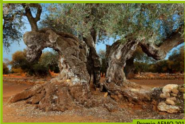
Premio AEMO 2014