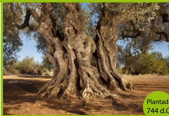
11 Àrea Mas Na Cabanes G 40.550377 0.352831

Al lado del camino que va del pueblo a la ermita del Socors, de acuerdo con los propietarios, se ha acondicionado esta área, señalizando los dos olivos milenarios más monumentales que hay en ella.